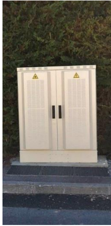
NRO (nœud de raccordement optique)