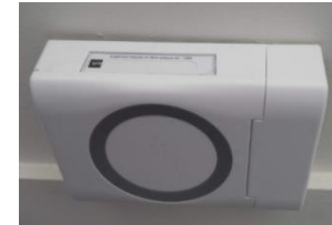
PTO (point de terminaison optique)