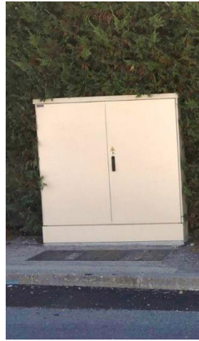
PM (Point de Mutualisation)