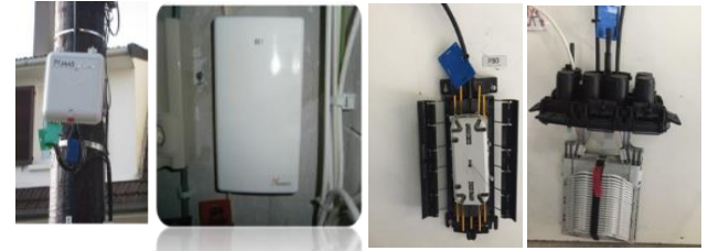
PBO (Point de branchement optique)